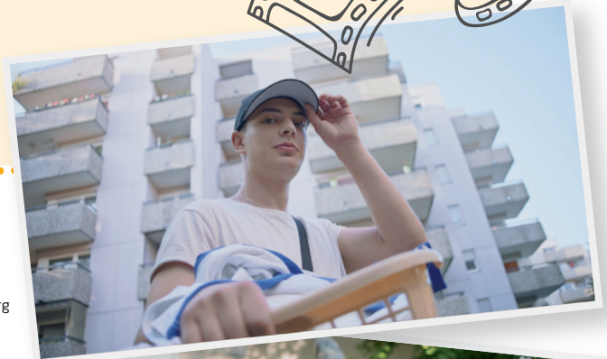
©MASEL TOV COCKTAIL Regie: Arkadij Khaet, Mickey Paatzsch Produktion: Filmakademie Baden-Württemberg