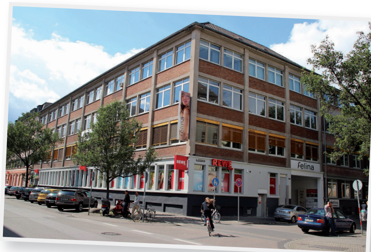
Foto (c) Frank C. Müller, CC BY-SA 4.0, https://commons.wikimedia.org/w/index.php?curid=34835747

Quelle: Das Erste | Panorama | 75 Jahre Pogromnacht: „Arisierte“ Firmen heute (abgerufen am 17.01.2022)